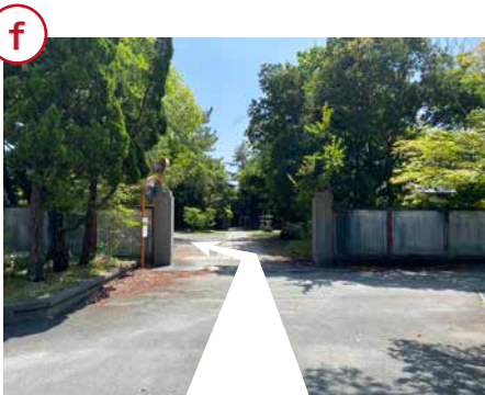
常楽寺の敷地内を左へ。