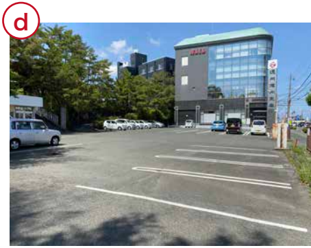
こちらの駐車場の空きスペースにお止めください。