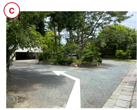
車庫の出入りの邪魔にならない、築山周辺にお止めください。 車庫の右端が事務所入口です。