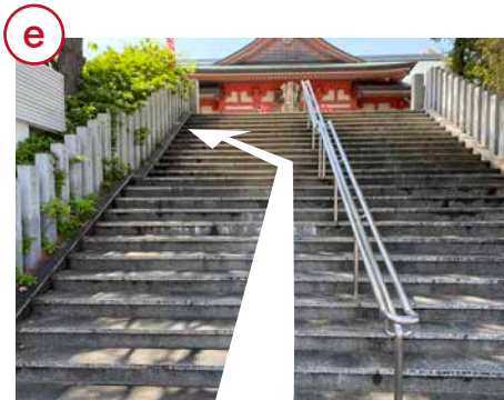
遠州信貴山の階段を上がり、左へ。

⚠ …お寺に上る坂がございますが、木々が生い茂る山門を通りますので、軽自動車以外はご注意ください。