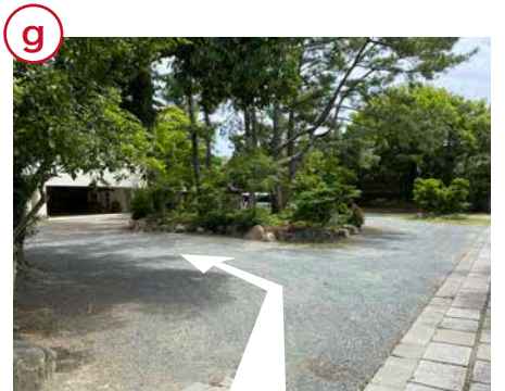
奥に見える車庫の右端が事務所入口です。